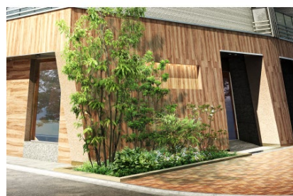
外観基壇部イメージ

サブカルチャー文化の発信地で若者の街である中野は、再開発により新しい街に変貌しつつあります。一方で、中野サンモールや新中野商店街など、人と人との温かな関係性と昔ながらの面影が残っています。その街に馴染むよう、基壇部は木目調のタイルで柔らかいイメージに、高層階は縦横のアルミ格子を配し、基壇部とのコントラストがアクセントとなるデザインとしました。