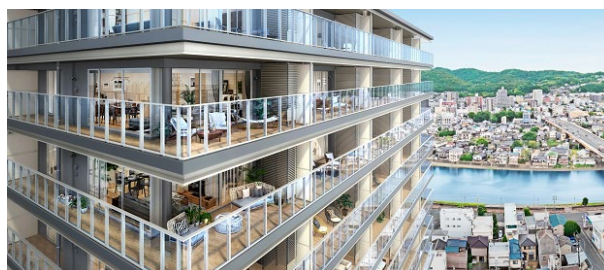
バルコニー（イメージ）

本物件は、岡山市の中心市街地である“都心1kmスクエア”内で建築中の再開発ビル内の9階から20階に位置します。全住戸が地上約38m以上に配置され、視界を遮るものがない開放的な眺望をご覧いただけます。専有面積は55.87㎡～86.42㎡、間取りは2LDK、3LDK、4LDKの全7タイプをそろえ、南向き住戸には、奥行き最大約2.7mの広々としたバルコニーを設置します。建物は「中間免震構造」を採用し、地震時に地面から伝わる揺れを低減します。また、オール電化で光熱費を抑えるとともに、くらしの安心・安全を守ります。