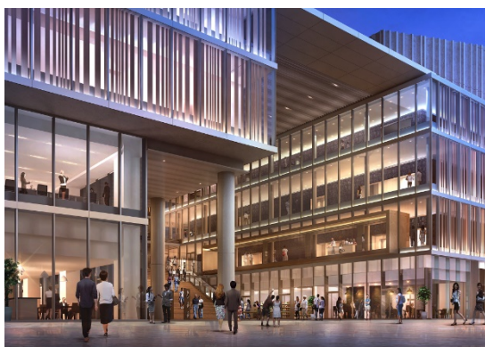
(仮称) 千日前スクエア (イメージ)

本再開発ビルは、ホール棟と事業棟からなる一体的な建物で、事業棟では 1 階は店舗・住宅エントランスとオフィスエントランス、2 階から 4 階は劇場フロア、5 階から 7 階はオフィスフロア、9 階から 20 階が住宅フロアになります。建物 1 階中央には街行く人が自由に出入りでき、劇場のエントランスとなる屋根付きの歩行者空間「(仮称) 千日前スクエア」を計画し、災害時には近隣の方が集まる防災拠点としての運用が予定されています。