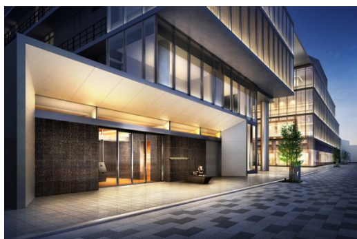
エントランス（イメージ）

また、大京オリジナルの各住戸専用の宅配ボックス「ライオンズマイボックス」を、岡山県で初導入します。住戸数に対する宅配ボックスの設置率は100%を超え、居住者全員がいつでも安心して荷物を受け取ることが可能です。