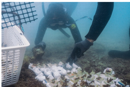
サンゴ植え付けの様子