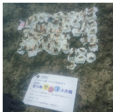
植え付け直後のサンゴ

なお、本取り組みは今年で9回目となり、サンゴの移植数は累計1,314本、拠出金の総額は4,700,754円になりました。