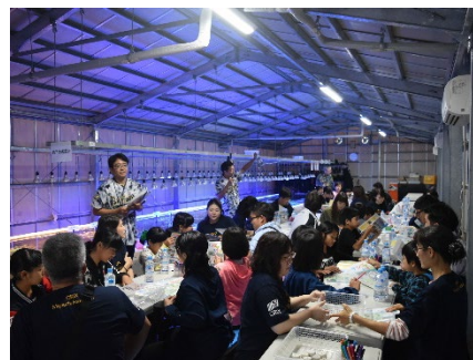
植え付けサンゴの苗作りの様子