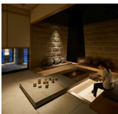
「ONSEN RYOKAN 由縁 札幌」いろり