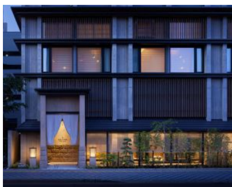
「ONSEN RYOKAN 由縁 札幌」外観