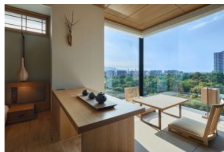
「ONSEN RYOKAN 由縁 札幌」客室

本物件は、当社と三信住建株式会社（本社：東京都中央区、社長：信田 博幸）が開発し、UDS 株式会社（本社：東京都渋谷区、社長：黒田 哲二）がデザインを担当しました。物件の斜め向かいには北海道大学植物園の豊かな緑が広がる立地で、植物園越しには札幌を囲む山々が連なり、札幌中心部にありながら北海道の豊かな自然を感じられるホテルです。約 20 m 2 から約 40 m 2 とスタンダードクラスでもゆったり過ごせる全 182 室で、大浴場には露天風呂やこもり湯や打たせ湯を設けています。