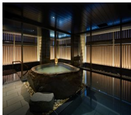
「ONSEN RYOKAN 由縁 札幌」大浴場