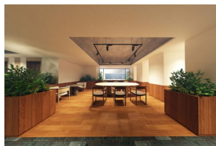
ラウンジイメージ

在宅勤務時などにご利用いただけるよう、1階のロビーには、Wi-Fi環境が整った共有のラウンジとコワーキングスペースを設置。また、不在中の宅配でも安心な各住戸専用の宅配ロッカー「ライオンズマイボックス」を設置しています。