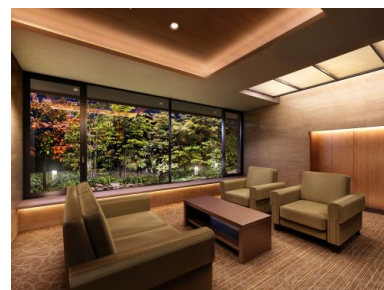
ラウンジ (イメージ)

訪問者との面談スペースやおくつろぎの場としてご利用いただけるホテルライクなデザインのラウンジを1階に設けました。周囲より高い天井からは間接照明の柔らかな光が上質さと落ち着きを演出します。また、大開口の窓越しに植栽の緑景が広がります。