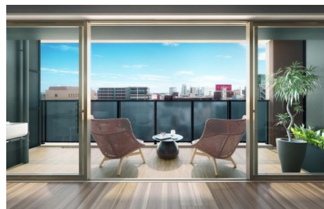
バルコニーからの眺め（イメージ）

「サーパス宮崎セントマークス」は、百貨店や複合型商業施設、金融機関、教育施設が集まる宮崎市の中心街「橋通3丁目」交差点より徒歩3分に位置します。車で宮崎自動車道の宮崎ICまで9分、宮崎空港まで11分と、アクセスも便利です。