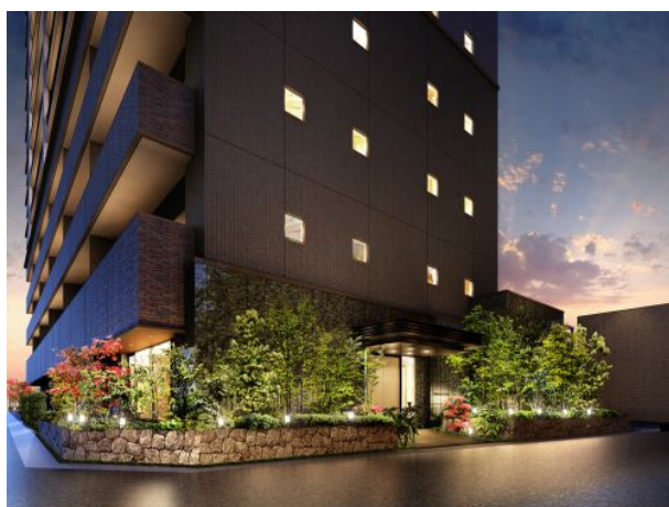
エントランスアプローチ（イメージ）

低層階は公園からの視線を意識し、岩肌調の立体的なタイルを使用して重厚感を醸成しました。一方、中高層階は中央住戸のバルコニーにガラス素材を利用し、軽快感を出しています。さらにエントランスアプローチの周囲には天然石を積み上げることで建物全体との一体感を高めました。