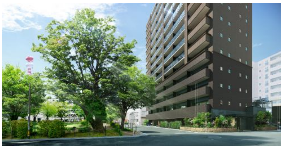
公園隣接の外観イメージ

「サーパス宮崎セントマークス」は、徒歩圏内に「宮崎山形屋」や「宮崎ナナイロ」などの百貨店や複合型商業施設、また「宮崎県立病院」「三愛保育園」「宮崎西小学校」などの医療機関や教育施設があり、生活利便性に優れます。また、徒歩2分の宮崎交通バス「MRT前」バス停より、JR日豊本線「宮崎」駅へ4分、宮崎空港へ22分と、国内・国外の旅行や出張の際にも快適なアクセスです。市民の憩いの場となっている「二葉街区公園」に隣接し、自然豊かな環境に恵まれたエリアです。