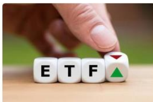
将来に備え、じっくり資産を増やしたい！長期投資に適した主要資産ETF