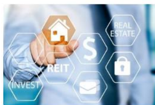
少額から始められる不動産投資4選