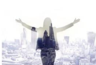
不動産投資の成功率を上げる8つの方法