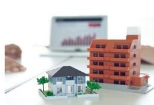
不動産投資の種類はいくつある？ 代表的な投資方法を紹介