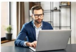
30代以降も成長できる人とは？70歳まで雇用される人材を目指して