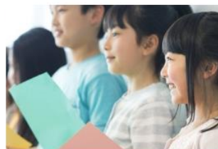
習い事漬けは無意味？成績が良い子どもを育てる親の共通点