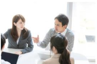
50代で後悔しないために！30代で必ずやるべきこと