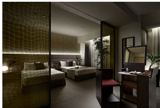
マスターベッドルーム（モデルルーム）