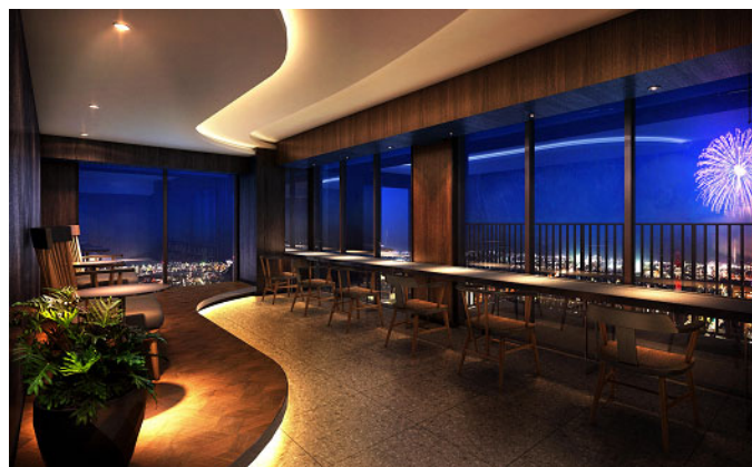
スカイラウンジのラウンジ（イメージ）

本物件は、岐阜市が設定した「まちなか居住重点区域」の中心となる柳ヶ瀬エリアに位置し、官民一体の複合再開発の「住」を担います。地上35階建て、岐阜県最大*の総戸数335戸のタワーマンションとして、2023年3月の入居開始を目指します。