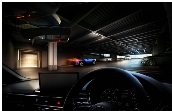
カーエントランスおよび駐車場（イメージ）