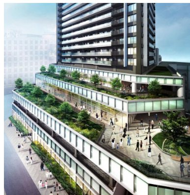
柳ヶ瀬ガラスル 35（イメージ）

高島屋南地区第一種市街地再開発事業（柳ヶ瀬ガラスル 35）は、高島屋南市街地再開発組合が施行者として、岐阜県岐阜市柳ヶ瀬の南玄関口で推進している事業です。1、2階は商業施設、3、4階は岐阜市が整備する公益的施設となります。3階には、運動を通じた健康づくりを支える健康・運動施設や岐阜市中保健センターを、4階には遊びを通じた子どもの成長と子育てをサポートする子育て支援施設を整備する予定です。分譲マンション「ライオンズ岐阜プレミスタワー35」は5階～35階に位置し、柳ヶ瀬エリアのランドマークとして、中心市街地活性化の実現を目指します。