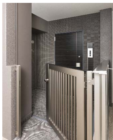
玄関ポーチ (イメージ)