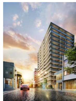
大手前通り沿いの外観イメージ

「サーパス高崎連雀町」は、高崎城正門に続く由緒ある「大手前通り」沿いに位置します。近隣には、老舗百貨店「スズラン百貨店」や、飲食店や美容院、ブティックなど多彩な店が軒を連ねる「大手前慈光通り商店街」など、商業店舗も充実しています。また本物件から約200m先にある高崎城址には、市役所や図書館、音楽ホールなどの文化施設、公園や学校などがあり、生活に必要な施設が身近に備わった住環境です。