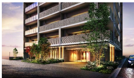
エントランス外観 (イメージ)

アースカラーを基調とした外壁には、バルコニーを仕切るマリオンが交互に連なりアクセントになっています。エントランス部分はダウンライトによる光の演出により、訪れる方々を上質な雰囲気でお迎えします。