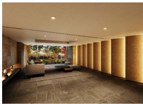
エントランス（イメージ）

「サーパス高崎連雀町」は、JR「高崎」駅および上信電鉄「高崎」駅より徒歩9分、高崎城の正門へ続く大手前通りに隣接する、高崎の中心地である連雀町に位置します。「高崎」駅は、上越新幹線、北陸新幹線をはじめ9路線が乗り入れする主要ターミナルとして、東京駅まで直通50分と都心へのアクセスも良好です。