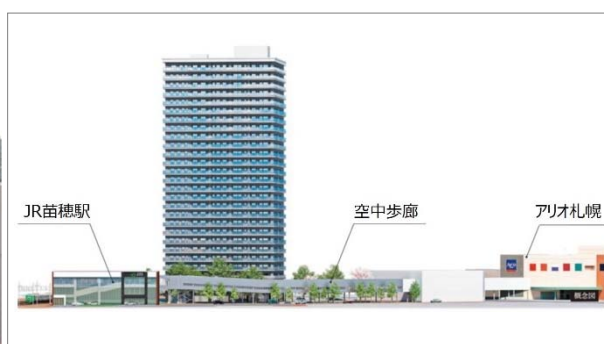
「空中歩廊」（イメージ図）

札幌の都市再生を進める本事業の一環として、「苗穂」駅北口から商業施設「アリオ札幌」1階敷地までの約200mを屋根や壁で覆われた全天候型の空中歩廊で結びます。「苗穂」駅の南北を結ぶ自由通路にも直結し、雨や雪の影響を受けることなく、快適にご移動いただけます。今後、アリオ札幌2階部分へ空中歩廊の開通を予定していますが、その時期については現在未定です。