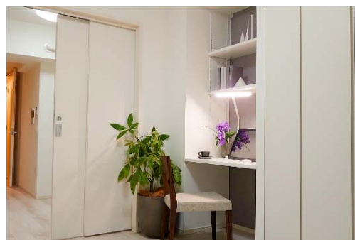
ライオンズフォーシア築地ステーション (壁面デスク)

在宅勤務の実施など働き方の多様化の進行に伴い、自宅に快適なワークスペースを確保するニーズが高まっています。本賃貸マンションの主要タイプ（1DK と 1LDK）を対象に本プランを導入しました。