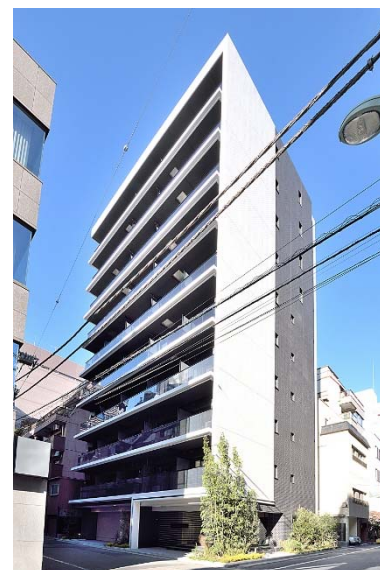
ライオンズフォーシア築地ステーション 外観