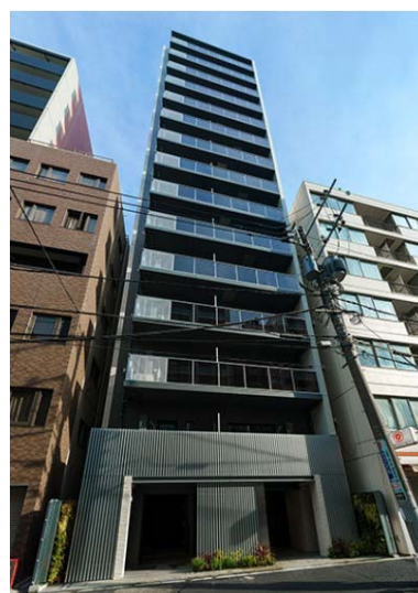
ライオンズフォーシア秋葉原イースト 外観