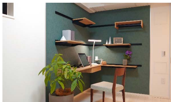
ライオンズフォーシア秋葉原イースト (壁面レール収納)

株式会社大京（本社：東京都渋谷区、社長：深谷 敏成）は、壁面レール収納や壁面デスクなどテレワーク機能付きの間取りを導入した新築賃貸マンション「ライオンズフォーシア秋葉原イースト」および「ライオンズフォーシア築地ステーション」において、2021年1月下旬より入居を開始しますのでお知らせします。