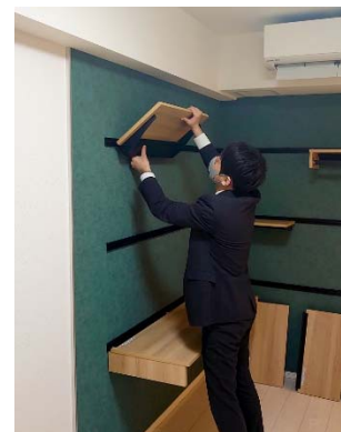
壁面レール収納 （取り外しイメージ）

壁面レール収納は、壁面に設置したレールに、カウンターデスク、棚板、ハンガー棚を自由に組み合わせてワークスペースを作ることができます。カウンターデスクと棚板を組み合わせてL型デスクとして使用するほか、アフターコロナを見据えてハンガー棚も用意しており、ワークスペースだけでなく柔軟性の高い収納としても活用いただけます。