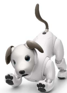
ソニー製エンタテインメントロボット “aibo”(アイボ)

aibo は、人との間に共感を生み出すことで育てる喜びや愛情の対象となることを目指して開発されたエンタテインメントロボットです。ソニーが長年培ってきたセンシング技術が搭載されており、体の各所に埋め込まれたカメラ、マイク、各種センサーなどで収集された外部からのデータをクラウド上で蓄積し、人工知能（AI）を使って処理を行うことで、賢く個性的に成長することができます。