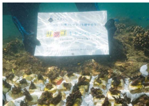
植付け直後のサンゴ

なお、本取り組みは今年で8回目となり、サンゴの移植数は累計 1,244 本、拠出金の総額は 4,502,524 円になりました。