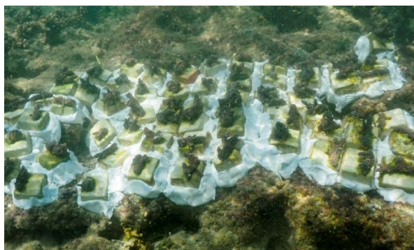
植付けられたサンゴ