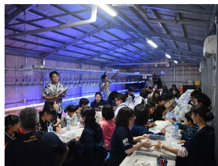
植付サンゴの苗作りの様子