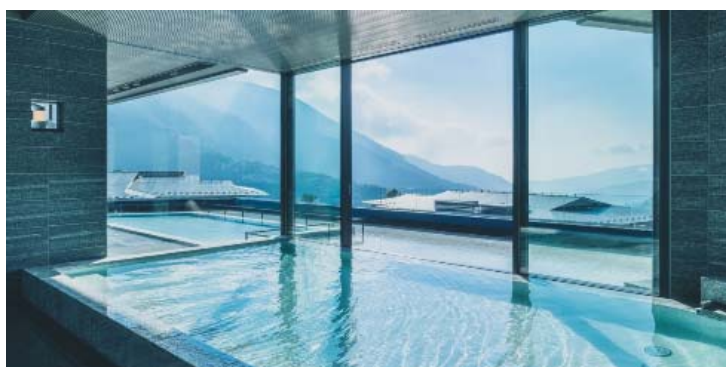
展望露天風呂「蒼海」

URL： https://www.youtube.com/watch?v=4nKAfid8eaI