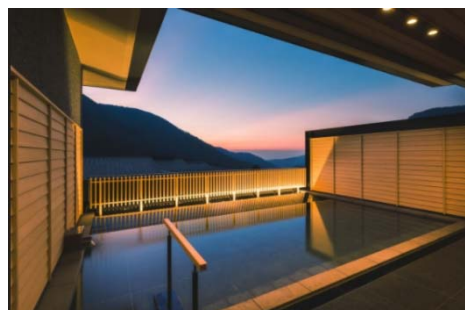
展望露天風呂「明星」

大文字や相模湾まで見通すことができる強羅屈指の展望露天風呂「蒼海」と「明星」を最上階に設けています。「蒼海」は、透明な温泉に映えるように浴槽など白を基調としており、水盤があしらわれた露天風呂からは景観に溶け込むような開放感を味わえます。「明星」は、通称“大文字山”と呼ばれる明星ヶ岳を見上げることができ、季節ごとに変化する情景をお楽しみいただけます。