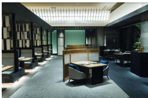
メインダイニング「六つ喜」

「六つ喜（むつき）」では、全国から厳選した旬の食材を使用した、会席料理をベースにした和食をお楽しみいただけます。夕食は、月わりの季節の前菜からはじまり、パティシエがつくる美しい水菓子など全8品で構成されます。メインは魚料理と肉料理、合わせて6種類の中から2品を選べるプリフィックスタイルでご提供します。朝食は、土鍋でふっくらと炊き上げた白米と、料理長がこだわり造りあげたごはんのお供をお召し上がりいただけます。