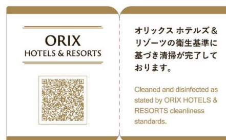
クリーンステイ・ルームシール（イメージ）

すべてのお客さまに、安心・安全にご利用いただけるよう、オリックス不動産株式会社とオリックス・ホテルマネジメント株式会社では、クレンリネスポリシー（『With COVID-19』下における運営・サービス指針）を策定し実践しています。