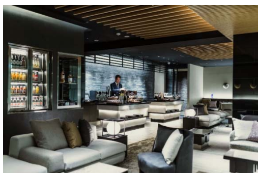
ゲストラウンジ 間 (AWAI)