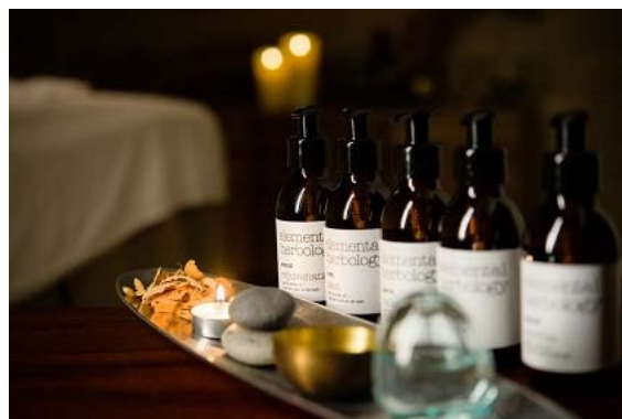
「Gora Spa AIOI」イメージ

本プランには、別館4階にあるスパ「Gora Spa AIOI（ゴウラ スパ アイオイ）」が提供する「五行説由来のスパ」が付いており、滞在中にセラピストのハンドのみで行われるスパトリートメントをご堪能いただけます。箱根・強羅の大地のエネルギーを体感いただけるよう、温泉と東洋の自然哲学・五行説の考えに基づく「Gora Spa AIOI」の各メニューにより、お客さまに癒しと活力を感じていただけるオーダーメイドのトリートメントをご提供します。ボディトリートメントからフェイシャルトリートメントまで完全個室で施術を受けることができます。