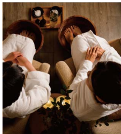
ペアでのスパ施術イメージ

「Gora Spa AIOI」でしか体験できない「温泉×五行説」という組み合わせは、身体・心・精神のバランスを整え、本来持つ健やかな美しさを引き出します。