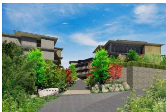
「箱根・強羅 佳ら久」外観イメージ

全 70 室デラックスルームで客室露天風呂付き、箱根・強羅の雄大な自然に育まれた天然温泉を存分にお楽しみいただけるよう、二つの展望露天風呂と三つの貸切風呂を備えています。