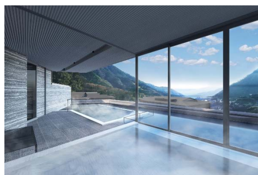
「箱根・強羅 佳ら久」展望露天風呂「蒼海」

・ニュースリリース～「ORIX HOTELS & RESORTS」の新築旅館「箱根・強羅 佳ら久」2020年10月2日に開業