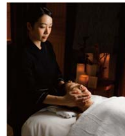
スパの施術イメージ

開業を記念して、「箱根・強羅 佳ら久」の天然温泉を存分に楽しんでいただくとともに、セラピストのハンドのみで行われるスパトリートメント「五行説由来のスパ」をご堪能いただけるメニューが付いた宿泊プランです。