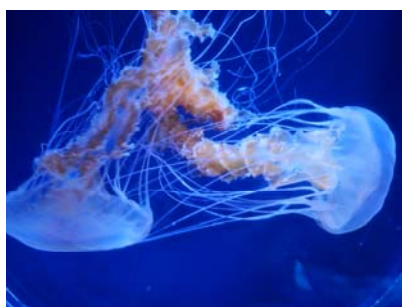
ブラックシーネットル