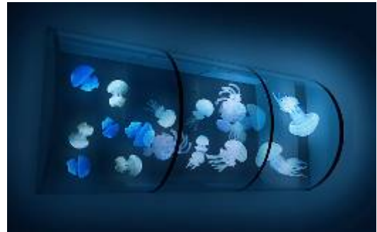
壁面に設置する 3 つのドラム型水槽 (イメージ)

今回のリニューアルにより、館内で展示する約 14 種 700 匹のクラゲはすべて、すみだ水族館で繁殖をした個体となります。