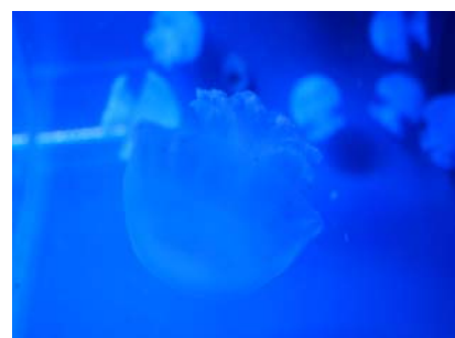
キャノンボールジェリー