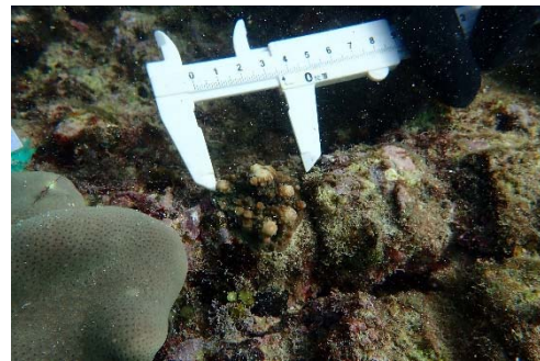
幅 3.6 cm (2019年12月撮影)