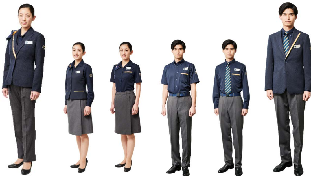
女性フロントスタイル

「オフィシャル感」「クリエイティビティ」「インテリジェンス」の3つを重要なテーマとして設定しました。スタイリッシュで頼れる印象のジャケットと、作業着に見えないスリム&スマートなブルゾンを採用。それぞれオリックスレンタカーのブランドカラーであるネイビーをベースに、イエローのラインやロゴマークを配置しています。また、全制服に動きやすさと着心地を重視したパターンとストレッチ素材を使用しています。