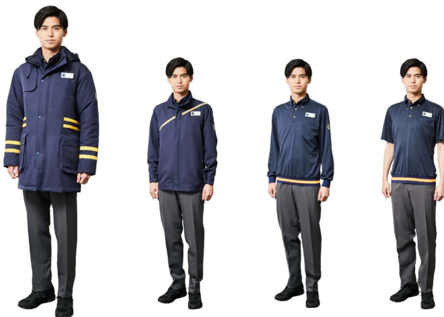
バックヤードスタイル (男女兼用)