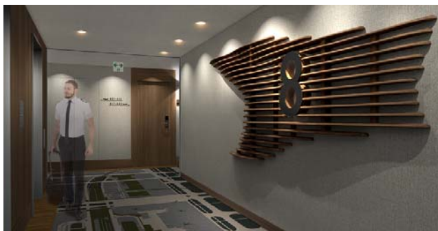
共用部分 (イメージ)