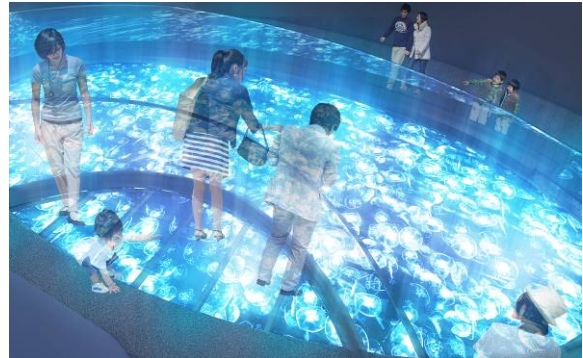
張り出すガラス床（イメージ）

現在クラゲを展示している「アクアラボ」、水槽が絵画のように並んだ「アクアギャラリー」を全面改修します。約2倍の広さに拡張する新しい「クラゲエリア」には、長径7メートル、短径3メートルの水盤型水槽を新設します。ふわふわと漂う約500匹のミズクラゲを、上から直に観察できます。水盤の一部には、水面に張り出すガラスの床のデッキを設置し、足元をクラゲが横切り、まるで水面に立っているような浮遊感を感じます。