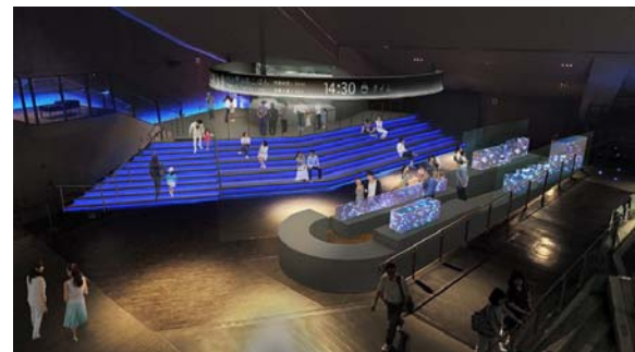
オープンスペースの全景（イメージ）

これまで「アクアラボ」で展示・公開していた飼育設備や飼育作業を移設し、新たに調餌のようすもご覧いただけるオープンスペースになります。ガラス張りの調餌スペースでは、飼育スタッフがいきもののゴハンを準備する作業を間近でご覧いただけます。ゴハンの時間や館内のリアルタイムな情報は、オープンスペースの中央の頭上に設置する、直径約10メートルの大きなリング型サイネージから発信し、水族館での過ごし方や学び、体験を刺激します。