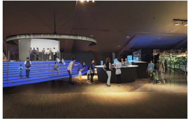
新しくなるオープンな飼育作業エリア（イメージ） ※現「すみだステージ」

本リニューアルでは、クラゲの飼育作業などを観察できる「アクアラボ」、水槽が絵画のように並んでいる「アクアギャラリー」および、多目的スペース「すみだステージ」を全面改修し、いきものや飼育作業をより間近に観察できる2つの新エリアを開設します。