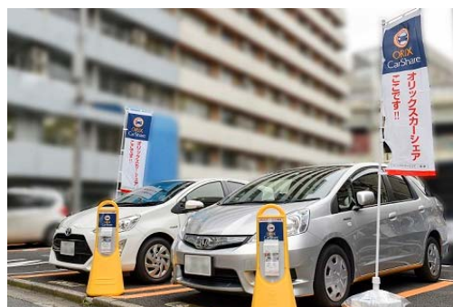
オリックスカーシェア（イメージ）

（2018年9月末）で展開しており、本提携によりさらなるカーシェアリング事業の拡大を進めます。