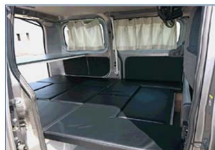
腰掛やフルフラットにして、休憩スペースとしても活用いただけるタイプも新たにご用意しました。

*各営業所の所在地、連絡先などは、以下の URL よりホームページをご覧ください。