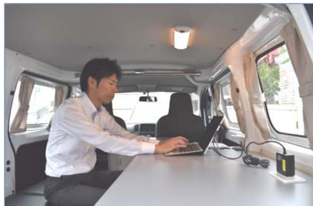
お客さまからのご要望で作業スペースを広く改良しています