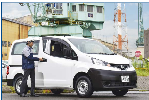
日産 NV200 をベースとした車両