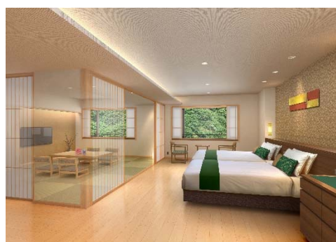
本館和洋室 イメージ

当旅館は、2017年12月より営業を休止し、リニューアル工事を行っています。今回のリニューアル工事では、本館の耐震化、客室の増設、貸切風呂やリラクゼーションルームの新設、そして、富山の海と黒部の豊かな自然の恵みを生かしたバイキングレストランのメニューを一新することにより、お客さまがより安心してお寛ぎいただける旅館へと刷新します。