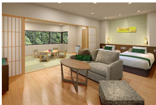
別館和洋室 イメージ

本館共用スペースはデザインに宇奈月の山野草をモチーフに取り入れ、より一層、北陸の魅力を感じていただける施設を目指します。