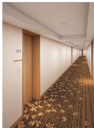
本館客室廊下 イメージ