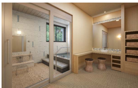
貸切風呂 イメージ