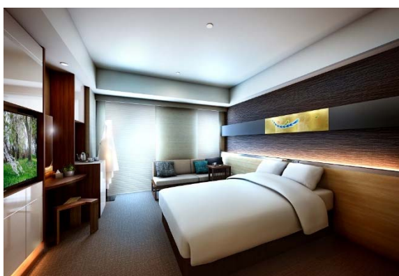
スーパーリア キング（30㎡）イメージ