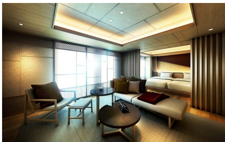
和スイート（70㎡）イメージ

オリックス不動産株式会社（本社：東京都港区、社長：高橋 豊典）は、2018年6月25日（月）正午より、「クロスホテル京都」（所在地：京都市中京区）の予約受付を公式ウェブサイトを開始しますのでお知らせします。当ホテルの開業は本年秋を予定しています。