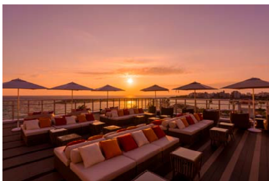
43 West Rooftop Bar (ウエスト ルーフトップバー)

2 つの屋外プールは、ファミリー向けのスライダー付きプールと、落ち着いた雰囲気の大人数向けプールです。宿泊ゲストは隣接する「ヒルトン沖縄北谷リゾート」の屋内外プールやスパ「Amami Spa (アマミスパ)」もご利用可能で、沖縄の海はもちろん、優雅な滞在をお楽しみいただけます。