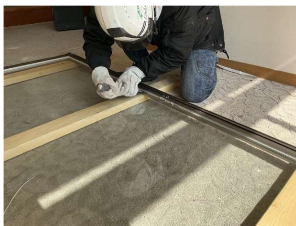
窓をガラスとアルミサッシに分離

本取り組みは、オリックスおよびオリックス環境が確立したアルミ窓全体の水平リサイクルのスキーム※1（以下「本スキーム」）を活用し、不動産事業と環境事業の連携によりサーキュラーエコノミーを実現したものです。本スキームの九州での実現は、今回が初となります。