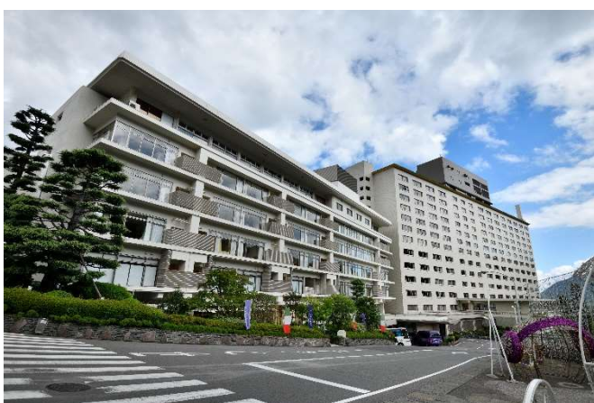
建物左：2025年1月に閉館した 別府温泉 杉乃井ホテル「中館」

オリックス不動産株式会社（本社：東京都港区、社長：北村 達也）、オリックス株式会社（本社：東京都港区、社長：高橋 英丈）およびオリックス環境株式会社（本社：東京都港区、社長：山下 英峰）は、「別府温泉 杉乃井ホテル（以下「杉乃井ホテル」）」の客室棟「中館（なかかん）」の解体により発生した使用済み窓ガラスおよびアルミサッシの水平リサイクルを実施しますので、お知らせします。