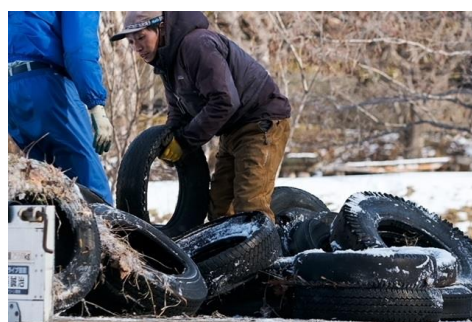
ごみ拾いによる水質保全活動