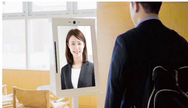
Copyright © 2024 Timeleap Inc. All Rights

オリックス自動車株式会社（本社：東京都港区、社長：上谷内 祐二）は、5月21日（火）～7月19日（金）までの期間、レンタカー店舗における人手不足への対応などを目的に、オリックスレンタカー新函館北斗駅前店（北海道北斗市）に、遠隔接客サービス「RURA（ルーラ）」（提供：タイムリープ株式会社）を試験導入しますのでお知らせします。