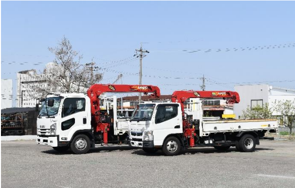
クレーントラック

バン（軽～ワンボックス）、冷凍車（軽～4t）、クレーン（2～4t）、ダンプ（軽～大型）、平トラック（軽～4t）、特殊車両など幅広いラインアップを取りそろえています。