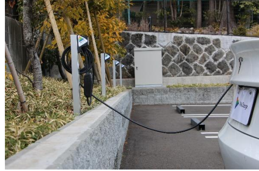
「箱根・強羅 佳ら久」駐車場