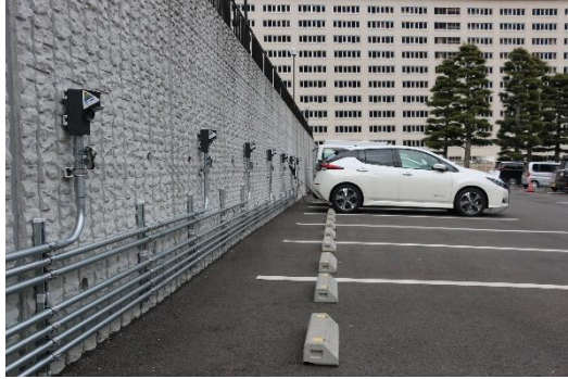
「別府温泉 杉乃井ホテル」駐車場