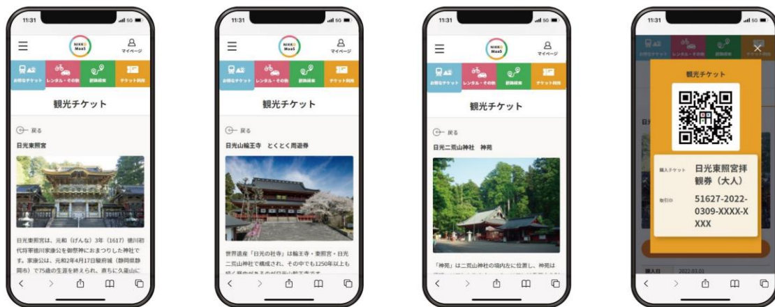
▲「NIKKO MaaS」観光チケット（イメージ）