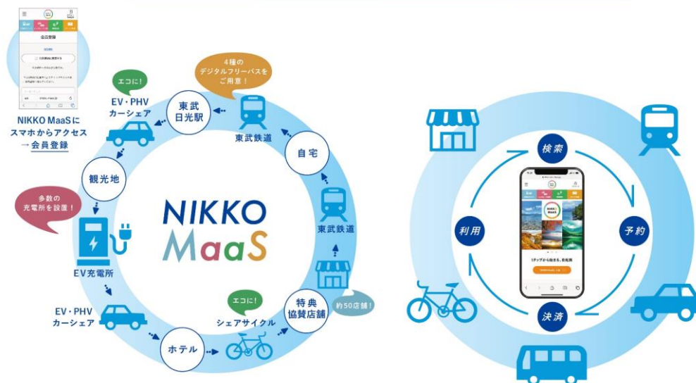
▲NIKKO MaaSでワンストップに「お得・便利・エコ」な日光観光（イメージ）