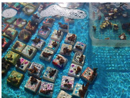
水産養殖研究センターで養殖されるサンゴ

沖電開発ではサンゴの養殖・植え付けのほか、サンゴ苗作り体験、サンゴ礁保全に関する環境学習を行っています。また、公益財団法人オリックス宮内財団では、毎年沖縄県下の子どもたちを同社のサンゴ養殖の拠点である水産養殖研究センター招き、植え付けサンゴの苗作りを行う活動『SANGO ORIX』を行っています。