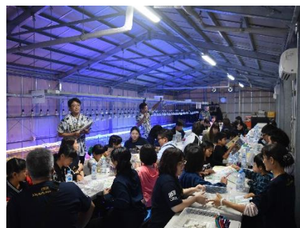
植付サンゴの苗作りの様子