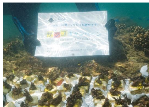
植付け直後のサンゴ

なお、本取り組みは今年で8回目となり、サンゴの移植数は累計 1,244 本、拠出金の総額は 4,502,524 円になりました。