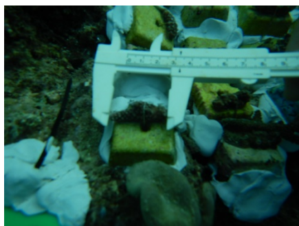
幅 3.3 cm (2018年12月撮影)

本キャンペーンで2018年に植え付けられたサンゴは1年間で0.3cm成長しました。少しずつですが着実に成長しています。