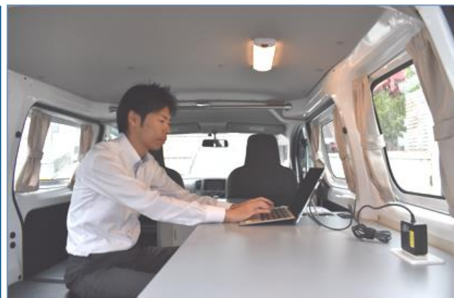
お客さまからのご要望で作業スペースを広く改良しています