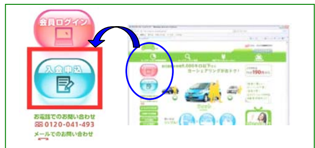
※トップページから WEB 入会申込ページへ