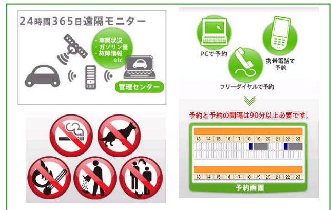
※入会説明は WEB 内の動画にて説明