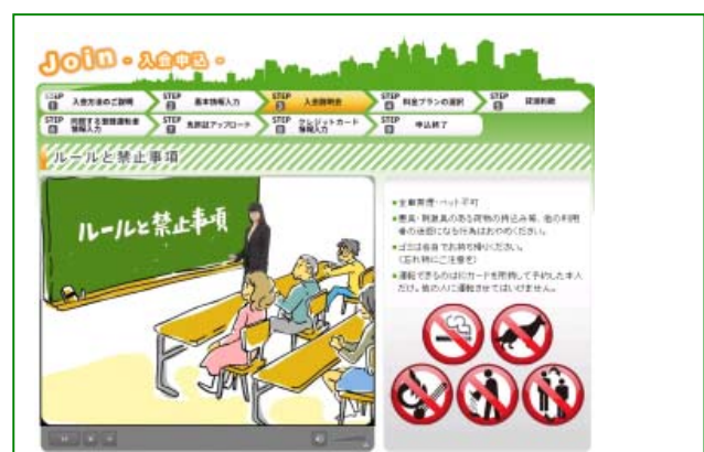
※イラスト付きの動画を用いて分かりやすくご説明します