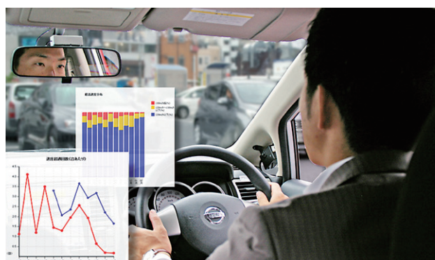
運行状況の可視化