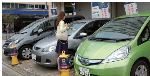
カーシェアリング