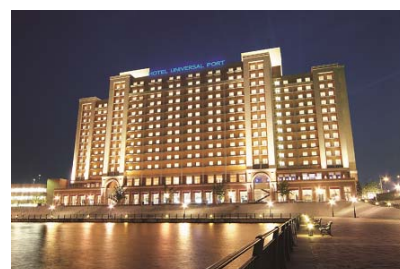
ホテル ユニバーサル ポート