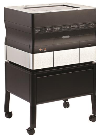
写真上：複数マテリアル対応デスクトップ 3D プリンター「Objet30 Pro」

本サービスでは、高解像度 3D プリンター「Objet30 Pro」を、月額 10 万円の特別価格で最大 6 カ月間のレンタルにてご提供します。本体のみならず 3D プリンターを稼動させるために必要な周辺機器や材料も含まれており、お客さまにとって導入前に 3D プリンターの機能と利点を検証いただくことができます。また、検証後に引き続きご利用を希望される場合は、継続プランとして長期レンタル（期間 26 カ月、もしくは 36 カ月）でのご提供が可能です。