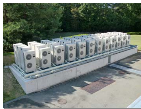
▲ 富士 OGMGC 小野コースへ導入したビル用マルチエアコン室外機（左）とヒートポンプ給湯器（右）