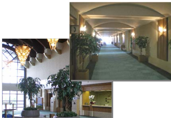
▲ LED 化された富士 OGMGC 市原コース