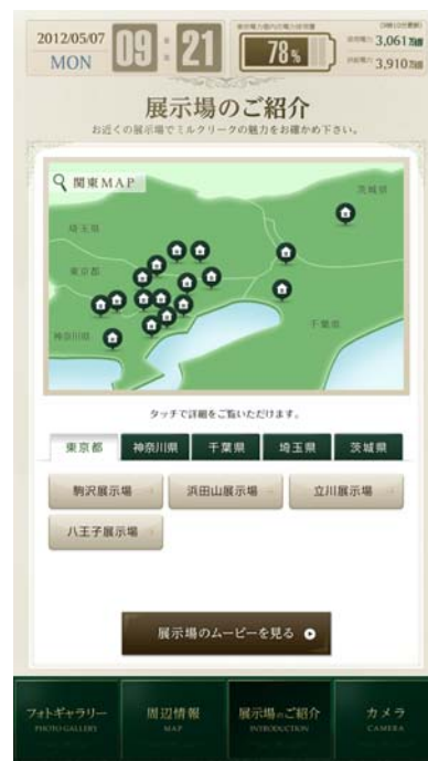
デジタルサイネージ (全体イメージ)