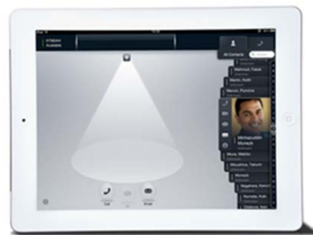
【Avaya Flare Communicator for iPad】

Avaya Flare Experience は、ビデオ、固定・携帯電話、インスタントメッセージ、メールなど複数のコミュニケーションツールを、ひとつのデバイスで統合的に利用できるコラボレーション・ソリューションです。連絡したい相手をワンタッチで選び、表示される在席状況に応じて最適なツールを選択し、容易な操作で利用できる点が特長です。「Avaya Flare Communicator for iPad」をダウンロードすれば、iPad ひとつで社内・外出先・自宅など、どこからでもコラボレーションを始めることが可能です。