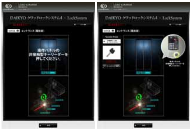
セキュリティシステムコンテンツ（参考イメージ）

マンションに住んでからのセキュリティシステムを画面上のCG動画にて体感していただけます。