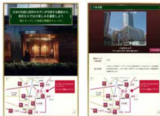
沿線施設・アクセス情報コンテンツ (参考イメージ)

マンション周辺のお店や学校、病院施設などの生活情報を地図上のアイコンで表現し、施設情報やストリートビューなども表示。またそれら施設までの道順をワンタッチで画面上に表示し、それを携帯電話・スマートフォンなどへメール送信することで持ち歩きも可能です。