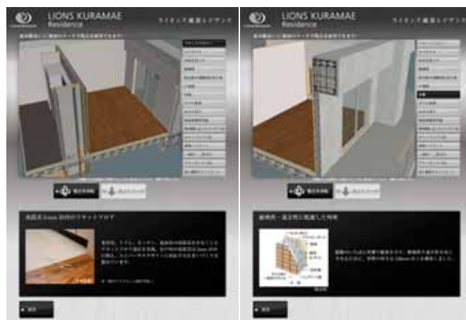
構造コンテンツ（参考イメージ）

3Dで作成されたマンション構造模型に触れることで、ズームしたり、回転させたりでき、構造躯体や設備等の基本性能をご確認いただけます。