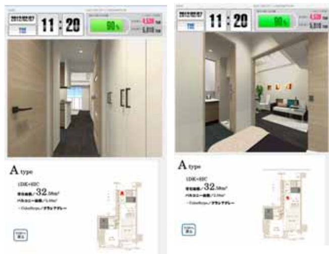
ウォークスルーコンテンツ（参考イメージ）

3Dグラフィックスで作成した部屋の中を、タッチパネルを操作しながら実際にその空間にいる感覚で自由に動き回る事ができます。