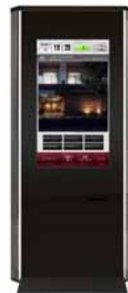
デジタルサイネージ (参考イメージ)

近年の情報化社会の中で、お客さまがマンションギャラリーに求める情報は多様化しており、深掘りしたい情報やマンションギャラリーでの滞在時間も異なることから、今回相互コミュニケーションのとれるデジタルサイネージを導入し、お客さま自身が主体的に情報を引き出せるシステムを採用しました。構造・セキュリティ対策への取り組みを分かりやすく伝えること、モデルルームでは表現しきれないお部屋のタイプやカラーを疑似体験できることのほか、今までの一方的な情報提供と所要時間によるお客さまのストレス軽減を目的としています。